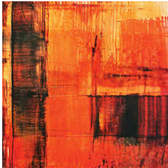
"Mémoire vive" 8, 61 x 61 cm, acrylique