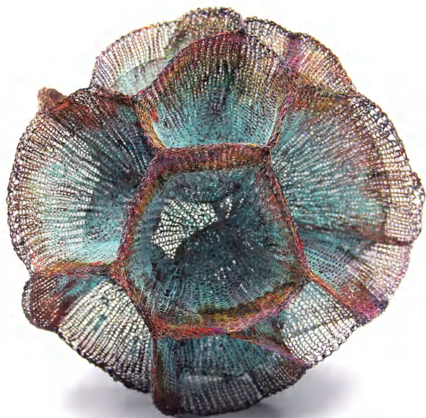
MARTA BLANC sculpture