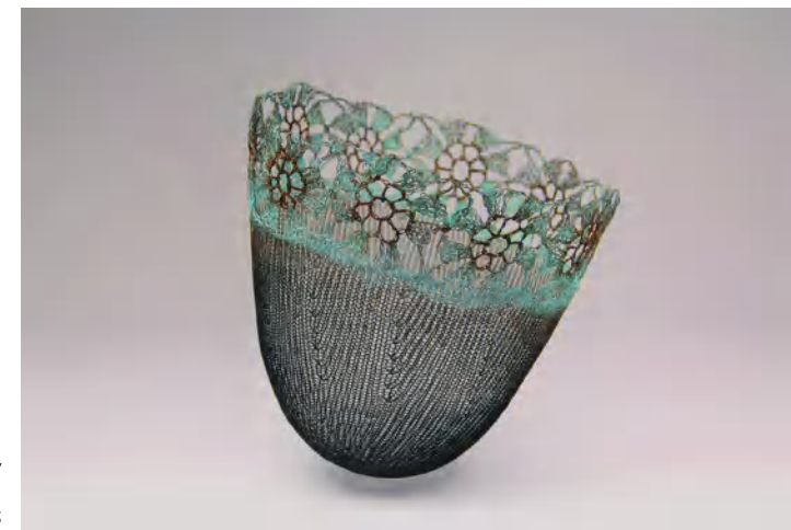
"Bol fleuri" Ø 18 cm, hauteur 17 cm fil de cuivre croché, oxydé

Marta Blanc compose des volumes atemporels faits de fils de métal – le plus souvent de cuivre, de fer et d'argent – formés et déformés, mélangeant gestes et matières au gré de recherches inattendues. Ses expérimentations multiples donnent naissance à des objets légers, transparents et organiques suggérant leur possible préexistence dans un lointain passé, une véritable archéologie du futur.