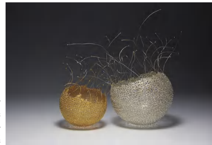
"Intimty" Ø 7 cm, hauteur 11 cm fil d'argent croché, doré